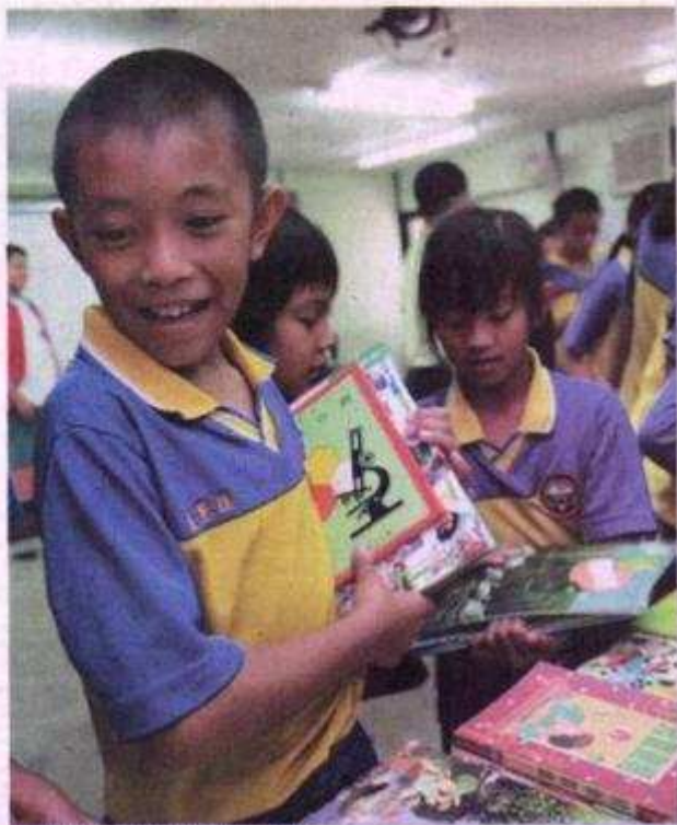
▲多閱讀讓小朋友不下山也知天下事。