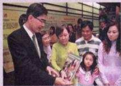
▲社區一家贊助計劃促進族群融合，讓外鄉婦女融入台灣社會，由被動受助者。